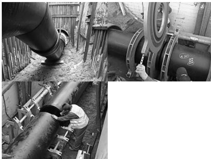
Rys. 4. Metoda Slipliningu w Bydgoszczy

przewodowej na prostych odcinkach wynosiła do 150 m. Skrzywienia rur i odchylenia do 3° opanowywano dzięki możliwości poruszania rur w połączeniach (sprzęgłach) lub dzięki elastyczności materiału. Przestrzeń międzyrurowa pomiędzy starą rurą a nową rurą przewodową była w zależności od potrzeb wypełniana środkiem iniekcyjnym, np. pianobetonem, popiołami lotnymi. Metoda ta idealnie nadaje się do terenów o gęstej zabudowie i intensywnym życiu gospodarczym, gdzie tradycyjne wykopy pochłonęłyby wiele pieniędzy i stworzyłyby znaczne problemy dla ruchu ulicznego i handlu.