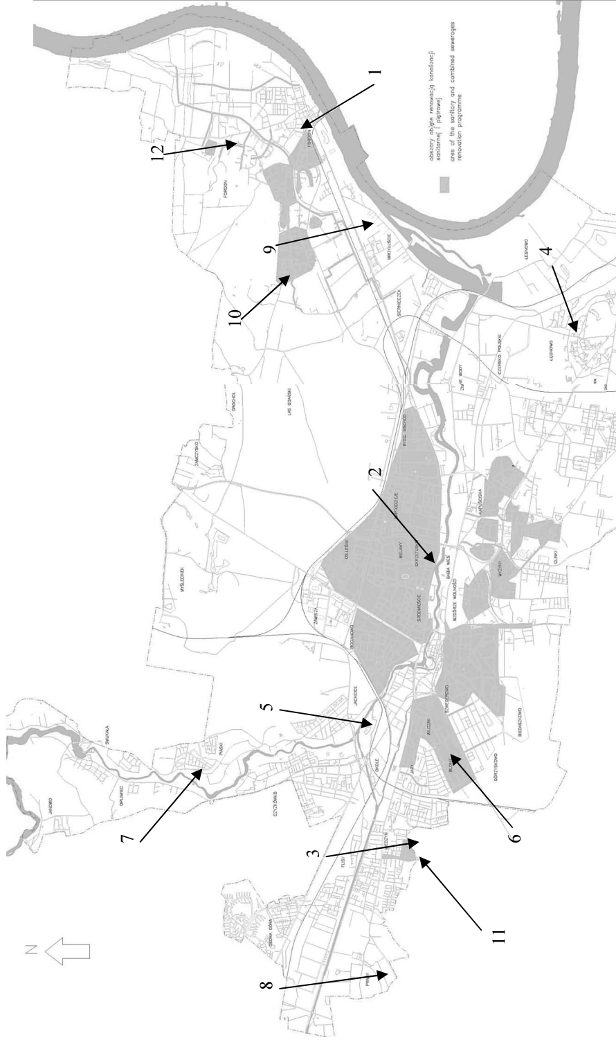
Rys. 5. Mapa satelitarna sieci wodociągowej miasta Bydgoszczy z uwzględnieniem miejsc poboru próbek do badań: 1. Ciasna 2. Chodkiewicza 3. Czorszyńska 4. Hutnicza 5. Jednostronna 6. Księżycowa 7. Hydrofornia Piaski 8. Rubinowa 9. Szlakowa 10. Wielicza 11. Wierzbowa 12. Wyzwolenia/Podgórze (opracowanie własne)