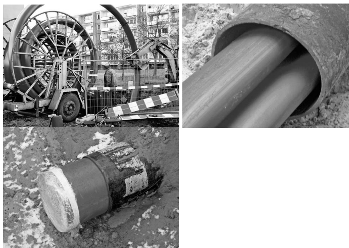
Rys. 2. Metoda Compact Pipe w Bydgoszczy w dzielnicy Fordon

Rura Compact Pipe jest wykładziną niezależną, a nowy rurociąg przejmuje w całości funkcję starego, co oznacza, że jest to niezależnie działający rurociąg o przewidywanej trwałości takiej samej jak typowa, zupełnie nowa instalacja.