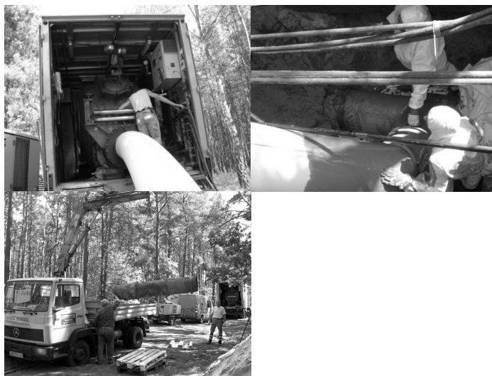
Rys. 3. Metoda Reliningu w mieście Bydgoszczy

Zaletą zastosowanej metody Reliningu w mieście Bydgoszczy był fakt, że renowacja nie powodowała zakłóceń w ruchu pojazdów i pieszych ani nie wpływa negatywnie na środowisko naturalne, ponadto montowane tą metodą przewody to nowoczesne rury o samonośnej statyce, a koszty stosowania metody Reliningu utrzymywały się na niskim poziomie dzięki krótkiemu okresowi montażu i niewielkim nakładom pracy w wykopach otwartych.