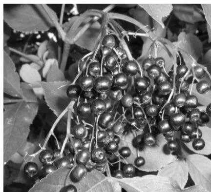
fol. K. Batóg