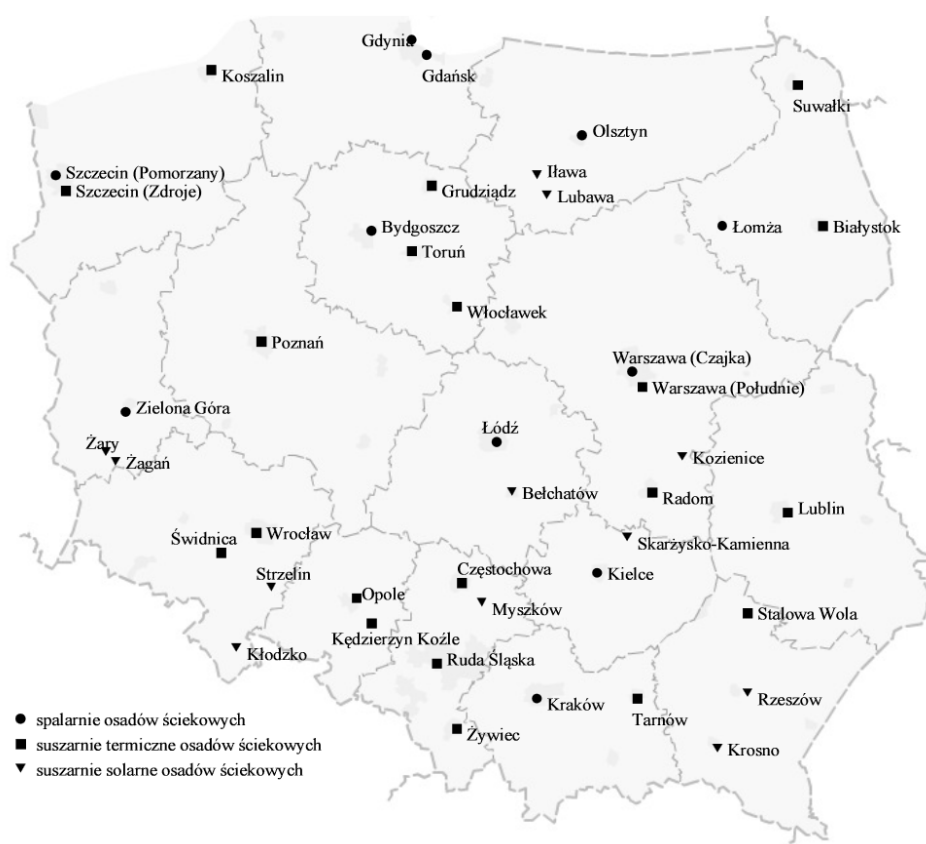
Rys. 2. Monospalarnie i suszarnie osadów ściekowych w Polsce [13]

wych [10], co stanowi ok. 1/3 wielkości wytwarzanej. Obecnie około 11% osadów (57 tys. Mg s.m. w 2012 r.) [11] jest przekształcane termicznie (3,7% w 2010 [12]). Na rysunku 2 przedstawiono rozmieszczenie instalacji do suszenia i spalania osadów z końca 2012 roku [13]; w siedmiu monospalarniach wykorzystuje się piece fluidalne (m.in. Gdańsk, Gdynia, Bydgoszcz, Łódź), w czterech - piece rusztowe (m.in. Szczecin). Większość monospalarni osadów ściekowych nie wytwarza energii elektrycznej, a pozyskane ciepło zużywane jest na własne potrzeby technologiczne - m.in. do procesu suszenia osadów. Popioły po spaleniu najczęściej są składowane na własnym składowisku odpadów innych niż niebezpieczne bądź przekazywane firmom zewnętrznym. Czasem zagospodarowywane są poprzez odzysk w instalacjach.