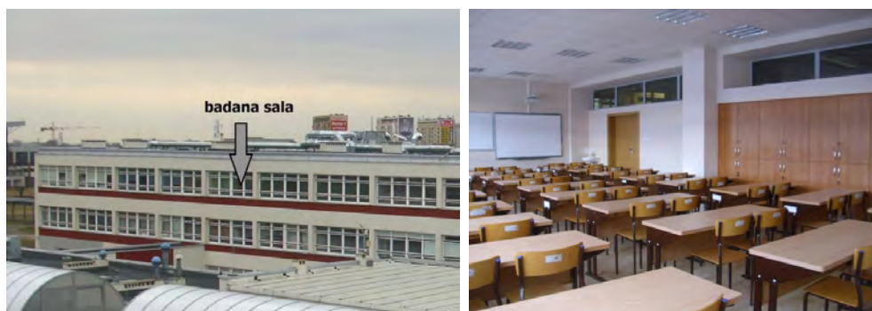
Rys. 1. Badana sala

Sala dydaktyczna, w której wykonano pomiary, znajduje się w budynku WBiŚ PB w Białymstoku (rys. 1).