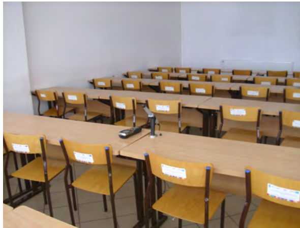
Rys. 2. Ustawienie aparatury pomiarowej